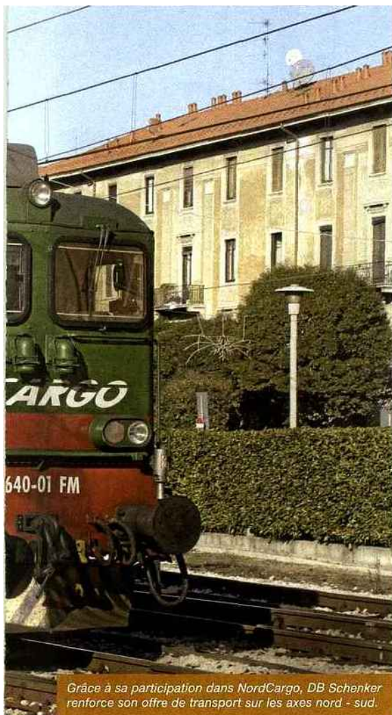
Grâce à sa participation dans NordCargo, DB Schenker renforce son offre de transport sur les axes nord - sud.